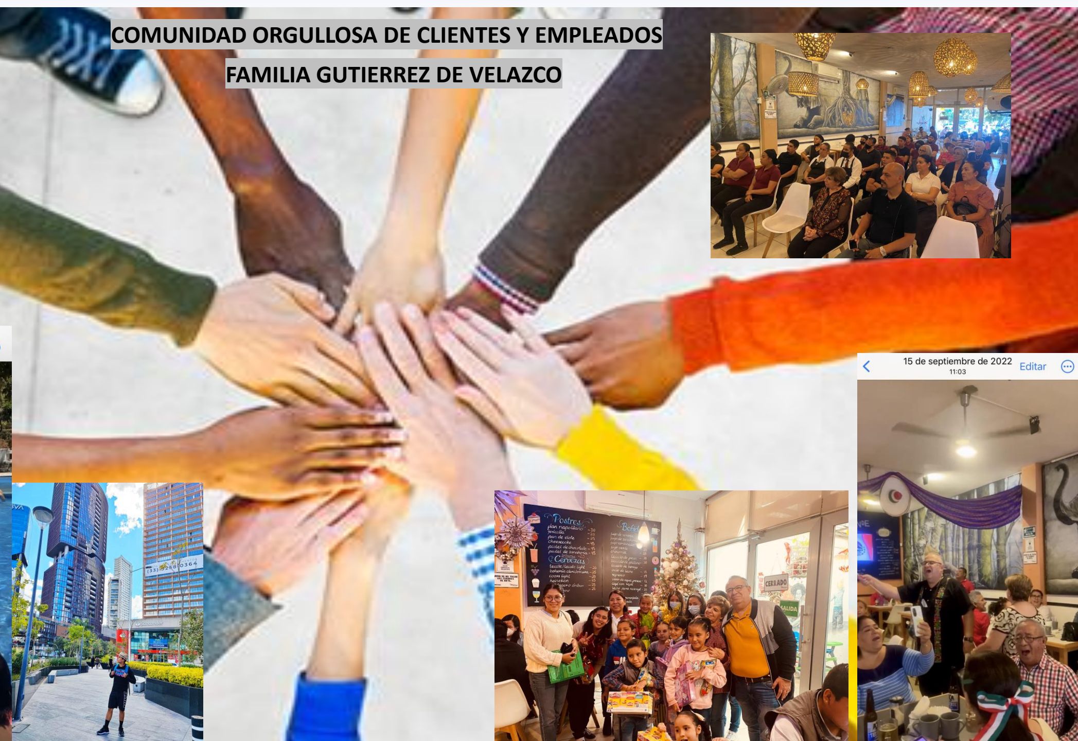
San Blas 27 de marzo 13:17 Editar