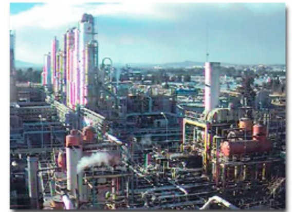
Planta Crysel, en Guadalajara